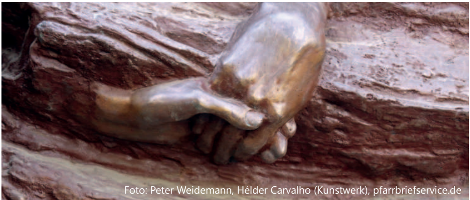
Foto: Peter Weidemann, Hélder Carvalho (Kunstwerk), pfarrbriefservice.de